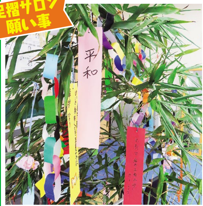
足摺サロン 願い事